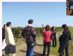
ボルドーのシャトー視察 (フランス)