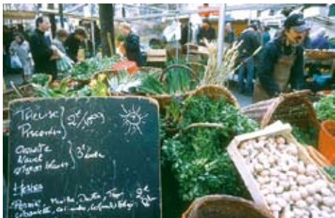
パティニョールのオーガニック朝市 (上) フタルの朝市 (下)

パリで暮らすなら、絶対に体験したいのが朝市（マルシェ）です。ほぼ毎日、パリ各地の広場や通りのどこかで、新鮮な果物や野菜、魚介類、畜産物、チーズ、パン、お菓子などを売る屋台がズラリと並びます。見て回るだけでも楽しいのですが、やっぱり味見をしたり、料理をしてみたくありませんか。そんな時におすすめなのが、実際に食材を選び、クッキングクラスで学びながら料理が作れるレッスンです。フランス人シェフに食材の選び方を教わりながら朝市で材料を購入したあと、約2時間のレッスンを受け、実際に料理にチャレンジします。できた料理はみんなで試食、もちろんレシピももらえます。朝市とクッキングレッスンが同時に体験できる、オトクなコースです。