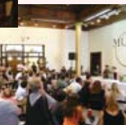
フラワーアレンジメントの先生 方によるデモンストレーション ツアー(クロアチア)