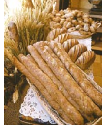
パン屋の店先 (上) チーズの盛り合わせ (下)

パリを訪れるなら、スイーツショップ巡りは必須。歴史ある菓子店からモダンなパティスリー、チョコレートショップ、コンフィズリーなど数えきれないくらいのお店が揃っています。ディスプレイもステキで、見ているだけでも飽きません。カフェやホテルのサロン・ド・テで優雅な時間を過ごすのもいいですね。たくさんあるお店を巡るのも楽しいのですが、せっかくパリで暮らすなら、ペーストリー教室に参加して本場のお菓子をレパートリーに加えてみませんか？ モンマルトルにあるフレンチ・ペーストリー料理教室で、フランスの典型的なペーストリーやデザート作りを体験してみましょう。作ったあとはもちろん試食。甘〜いひとときを楽しみましょう。