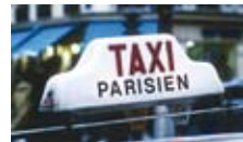
流しのタクシーはないので注意

一般的なパッケージツアーなどとは違い、空港に着いたら市内までは各自で移動しなければなりません。そこで到着時に空港から市内まで、帰国時に市内から空港まで、専用車で送迎サービスを用意、はじめてのパリ旅行でも安心ですね。なお、ヨーロッパの別の都市から列車でパリ入りする場合は主要駅からの送迎もあります。また、滞在中に専用車を貸切で利用できるサービスもあるので、ショッピングや食事などの際に利用すると便利です。