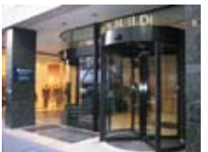
パリオフィスのエントランス