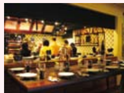
ジョエル・ロブション氏の レストランでクッキング スクール(モナコ)

アパルトマンをご利用のお客様も航空券、レンタカー、列車のチケット、パリ以外の都市へのご旅行お手配のご希望がある場合はぜひご活用下さいませ。お待ちしております。